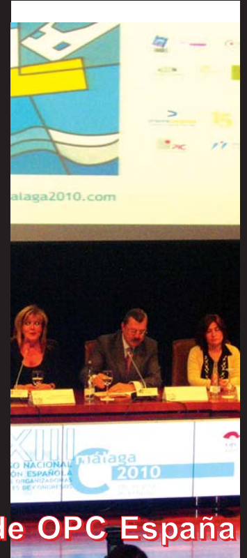
en Fitur Congressos y en la Reunión Nacional de OPC España