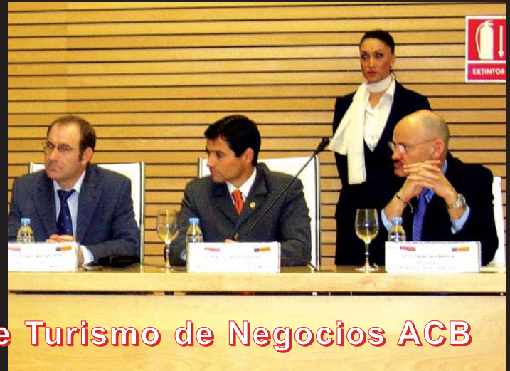
II Jornadas Profesionales de Turismo de Negocios ACB